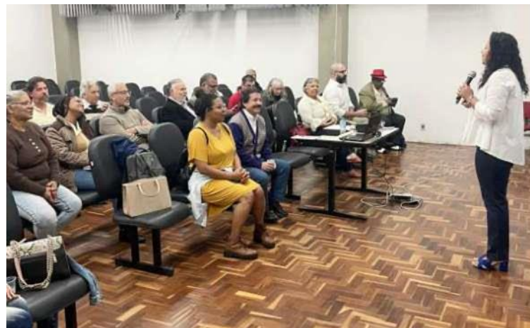
Legenda: Exemplo de Conselho em Funcionamento.