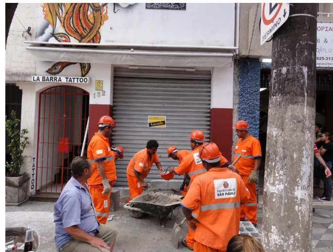
Legenda: Exemplo de fiscalização